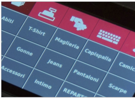
Tastiera touch screen configurabile, immediata ed intuitiva