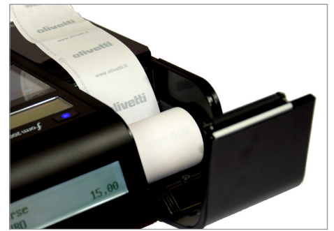
Inserimento rapido e agevole del rotolo carta