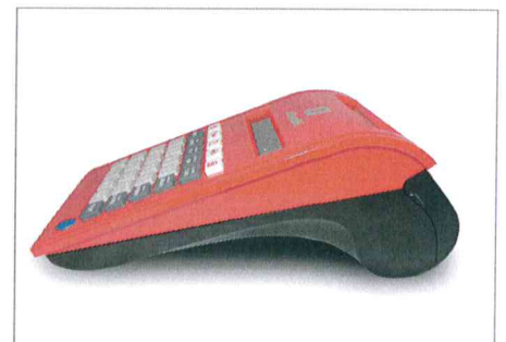
Forma compatta, linee curate e moderne