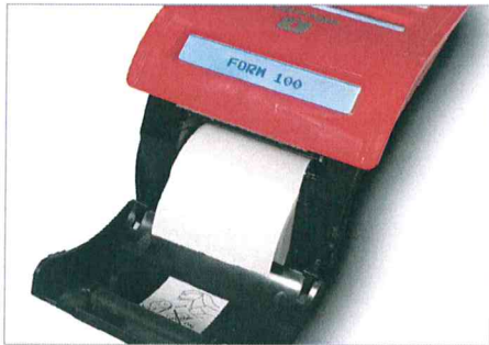
Inserimento rapido e agevole del rotolo carta